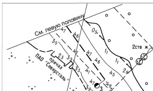
Вклейка № 4 Лист 50 части III тома 3

4. В нижней части причала апатита имеется конструкция шириной 4 м, выступающей за линию кордона причала на 3 м на высоте 9 м (от расчетного уровня 102,8 м).